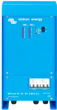
Skylla TG 24 30 GMDSS

con indicación del tiempo restante de carga de la batería