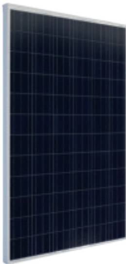
Panel solar 280W

Inversor kostal MP Plus mod. depende del kit (ver tabla inferior)