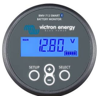
Detección de Bluetooth: BMV-712 Smart Battery Monitor