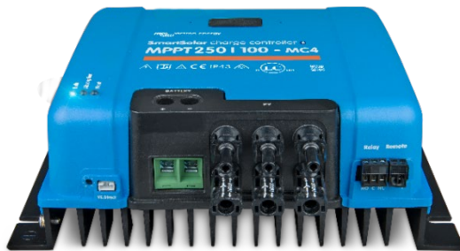
Controlador de carga SmartSolar MPPT 250/100-MC4 Sin pantalla