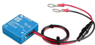
Detección de Bluetooth: Smart Battery Sense