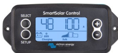
Pantalla enchufable SmartSolar