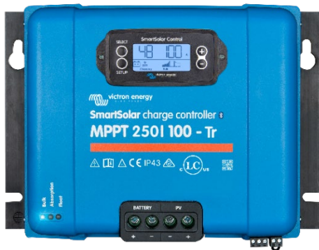
Controlador de carga SmartSolar MPPT 250/100-Tr Con pantalla conectable opcional.