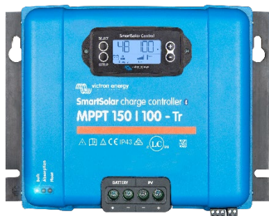
Controlador de carga SmartSolar MPPT 150/100-Tr Con pantalla conectable opcional.