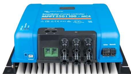
Controlador de carga SmartSolar MPPT 150/100-MC4 Sin pantalla