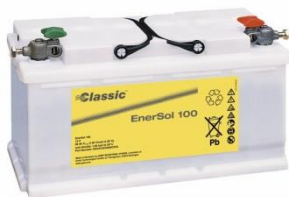
Densidad 1,28Kg/l a 25°C